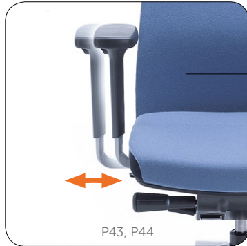
Armrest span adjustment. Breitenverstellbar.