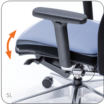
Seat tilt adjustment. Sitzneigeverstellung.