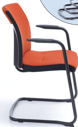
ONE 21V BLACK PU