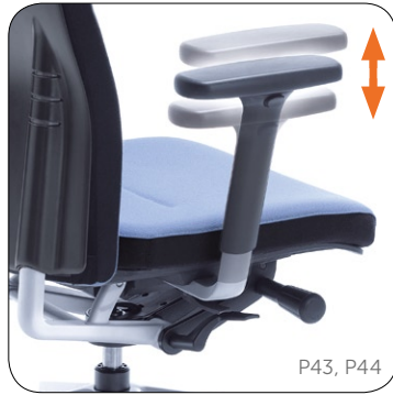
Armrest height adjustment. Höhenverstellbar.