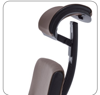
Headrest height and tilt adjustment. Kopfstütze höhen- und Neigungsverstellbar.