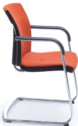
ONE 21VN CHROME O