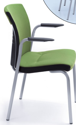
ONE 21H METALLIC PU