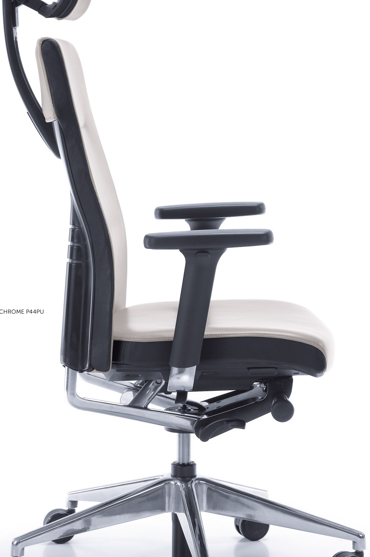
ONE 12SL CHROME P44PU