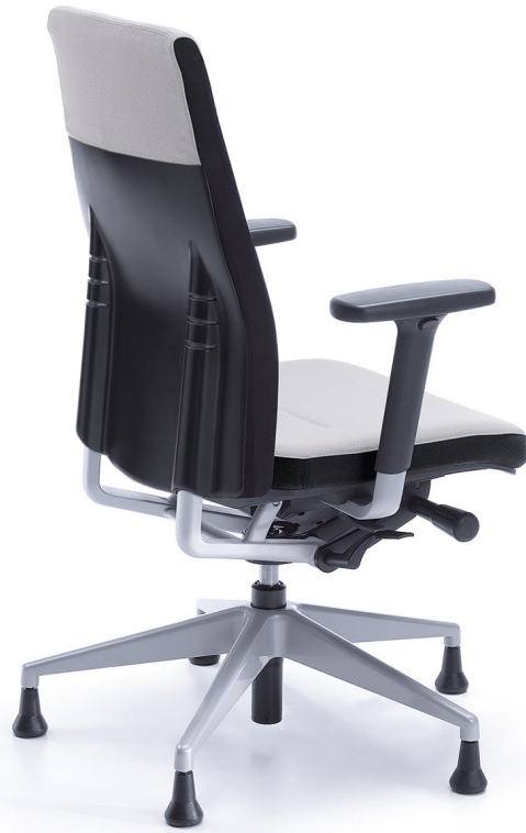
ONE 11SL METALLIC P43PU