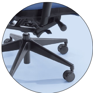
BLACK (plastic) SCHWARZ (Kunststoff)