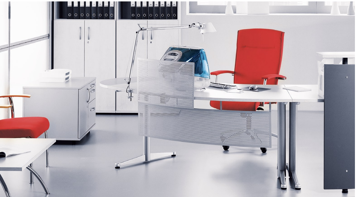
NIKO 11Z METALLIC O