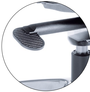
Seat height adjustment. Sitzhöhenverstellung.