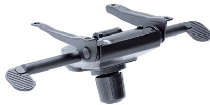
NIKO swivel armchair is equipped with hinged mechanism which enables user to recline the shell with the possibility to adjust the resilience to the weight of the sitting person.

Der NIKO Chefsessel ist mit einer Knie - Wippmechanik ausgestattet, die in zwei Positionen arretierbar ist.