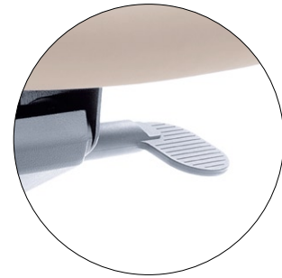
Adjustment of the tilt angle of a shell. Knie - Wippmechanik.