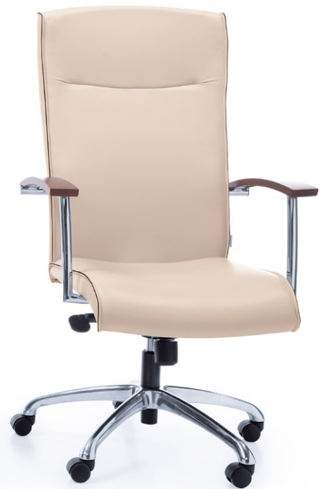
NIKO 11Z CHROME H