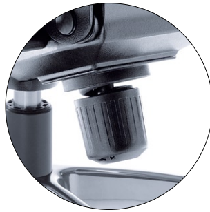
Tension force adjustment (fit to the weight of seating person). Federkrafteinstellung zur individuellen Einstellung des Gegendruckes der Rückenlehne auf das Körpergewicht.