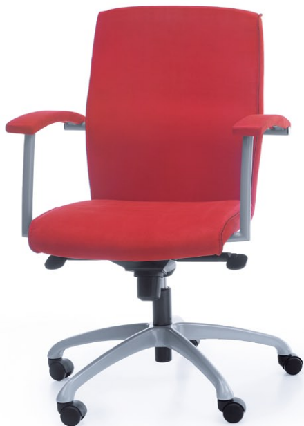
NIKO 41Z METALLIC O