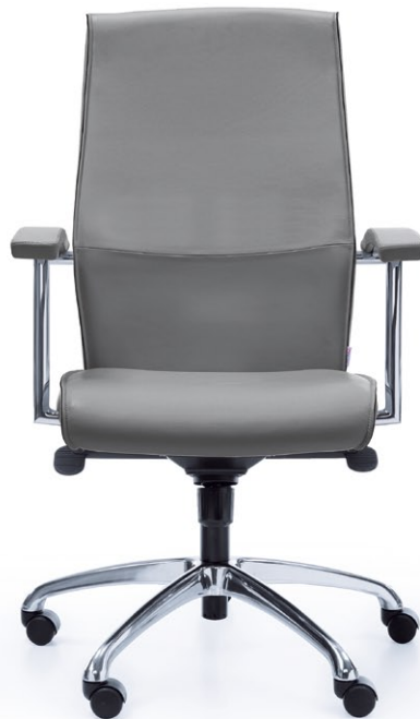
NIKO 31Z CHROME O