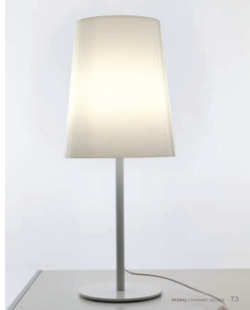
Table lamp with base and structure white or black powder coated and polycarbonate diffuser. Modular, with only two diffusers there is the possibility of four different combinations.

Lampada da tavolo con stelo e base verniciati bianco o nero e diffusore in policarbonato. Modulare, con solo due diffusori si possono avere quattro diverse combinazioni, in numerose varianti di colore.