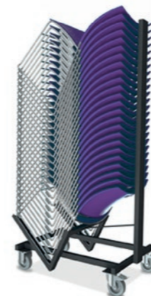
25 x Carver

F Des cafétarias aux salles de réunion, Carver procure à une pièce, un style original et contemporain. Déclinée dans 11 coloris de polypropylène, elle peut éventuellement être dotée d'un rembourrage. Une tablette écrivain et un panier à livres amovibles sont également proposés en option, lors d'une utilisation dans une salle de séminaire. L'assemblage au niveau du sol permet une disposition rapide en rangées. Il est possible d'empiler jusqu'à 25 chaises sur un chariot de transport et de les passer ensuite par une porte standard.